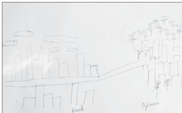
Рис. 1. Ментальна мапа

усвідомлюється мешканцями Ірпеня, а отже, відіграє помітну роль у їхньому повсякденному житті.