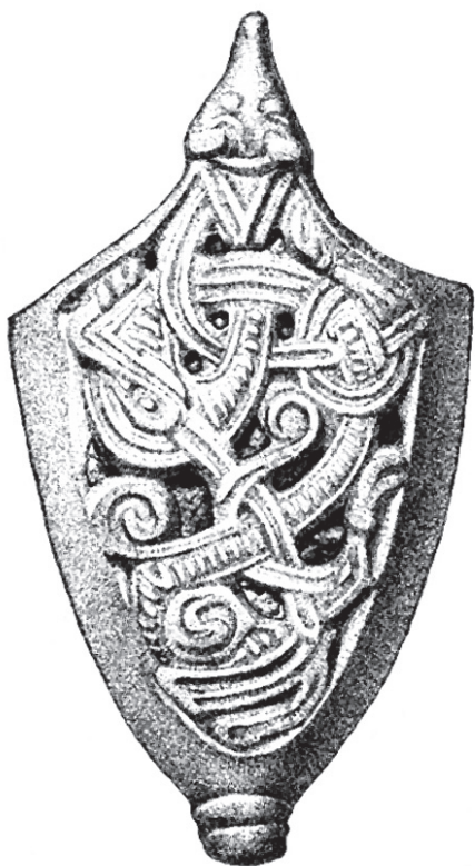
Ілюстрація 1. Наконечник піхов меча X ст. типу Гн-III.1 із зображенням чотирилапого звіра та змія. Мал. А. Дементьєвої. Археологічна пам'ятка Гньоздова (Смоленська область, Російська Федерація) [10].

стилізованого птаха-сокола, а деякі мають зображення чотирилапого хижого звіра. За даними німецького дослідника П. Паульсена, наконечники піхов з чотирилапим звіром і змієм (Ілюстрація 1) були поширені в Скандинавії в цей же період (окрім знайдених на теренах давньоруських земель, їх виявлено не менше чотирнадцяти одиниць) [25, s. 47], що є свідченням присутності норманів у руських військах. Разом з тим С. Каїнов відзначав, що існує й унікальне зображення чотирилапого звіра типу Гн-III.2 (Ілюстрація 2) [10, с. 95–97], варіанти