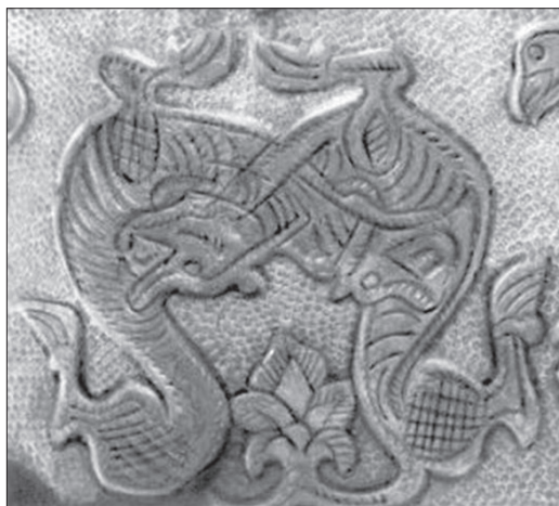
Ілюстрація 3. Зображення двобою вовків. Ритон з княжого кургану Чорна Могила. Середина X ст. (м. Чернігів, Україна). URL: https://ok.ru/ruyan/topic/62940443672684

Комплексний аналіз писемних джерел та археологічних матеріалів дає можливість стверджувати, що, окрім поодиноких контактів, перше масове