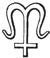
Знак з печатки Хрінницьких

Волинського і Белзького воеводств, а також Стефана, депутата на Коронний трибунал 1650 р. [28, s. 92]. Тож конкретна інформація стосується лише чотирьох представників роду кінця XVI – першої половини XVII ст.