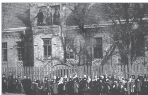
Дитячий будинок ім. Рози Люксембург (Запоріжжя, Кічкас).

Подібним способом на Запоріжжі було влаштовано дитячий притулок ім. Рози Люксембург на території колонії Кічкас (у зв'язку із будівництвом Дніпрогесу ця територія була затопленою). Притулок розташовувався у будинку колишнього менонітського архітектора Петерса. Притулок облаштовувався для 500 дітей віком від 5 до 17 років. З-поміж дітей 473 були сиротами, а 77 – напівсиротами, за національним складом 295 осіб значилися як українці, 184 росіяни, 6 євреїв, по троє болгар та поляків [6, арк. 67–70].