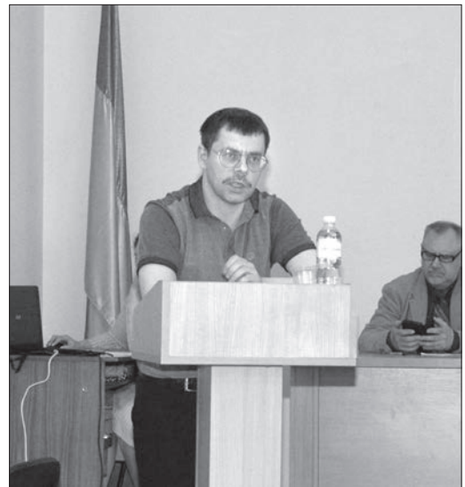
Головний консультант Апарату Верховної Ради України К. Грабчак

Головний консультант Апарату Верховної Ради України К. Грабчак у виступі «Збереження української ідентичності крізь призму етнічних цінностей» розкрив важливість для поступального розвитку української нації її тотожності, менталітету, рідної мови, звичаїв,