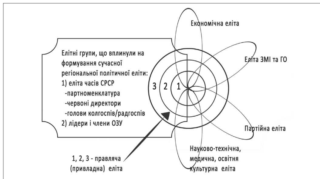
Рис. 1. Структура регіональної політичної еліти Вінниччини

У досліджуваній період регіональна політична еліта формувалася двома шляхами: електоральний (вибори) і адміністративний (призначення). Формування представницької влади у регіонах (ради