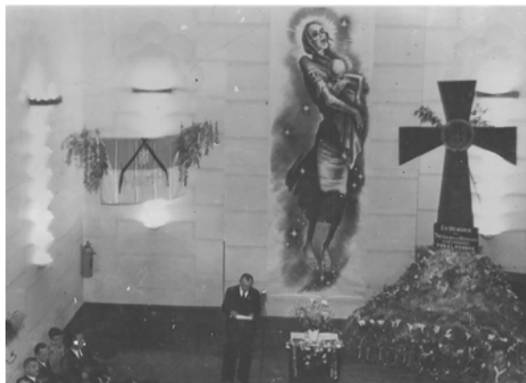
Жалібні сходи в 1953 р. у Товаристві «Просвіта» в Буенос-Айресі у пам'ять 20-х роковин Великого Голоду

промову, в якій розкрив природу злочину окупаційного комуністичного режиму та висловив впевненість у блискучій будучині українського народу. Його пророчі слова справили неабияке враження на присутніх [2, с. 175]. Як, очевидно, й оформлення великої зали Товариства «Просвіта», також виконане майстром, – у центрі він розмістив