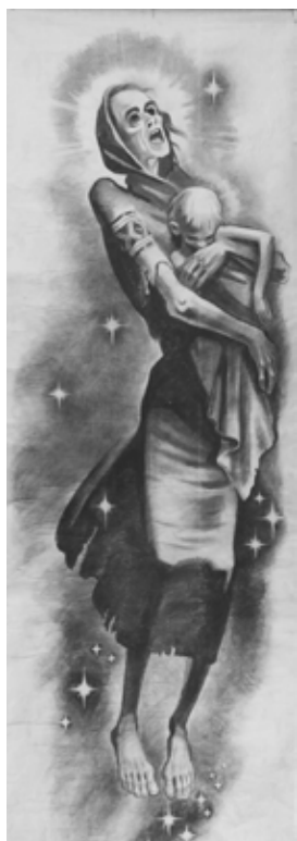
Варіант картини В. Цимбала «Рік 1933» (вугілля, папір)

Більш детально про цю виставку можна дізнатися з іспаномовного каталогу, який зберігається у родинному архіві Цимбалів. Відбувалася вона 9–22 листопада 1956 р. у столиці провінції Буенос-Айрес Ла Платі, ймовірно, у приміщенні Об'єднання журналістів провінції (ця організація зазначена на першій сторінці каталогу). Всього було виставлено 27 картин, серед яких у каталозі під номером 12 значиться «Рік 1933», причому з поясненням у дужках: