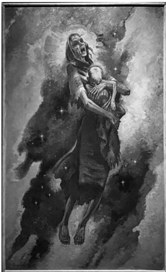
Картина В. Цимбала «Рік 1933»

Початок роботи В. Цимбала над картиною «Рік 1933» можна попередньо, спираючись на спогади дружини митця [15, с. 83], віднести до 1933–1934 рр. Відзначимо, що варто продовжити пошуки документальних матеріалів щодо процесу її створення. Безпосередній аналіз зображення твору, на нашу думку, дає можливість визначити час завершення роботи над картиною. У її нижньому лівому куті художник залишив напис