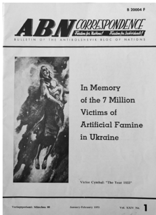
Обкладинка бюлетеня Антибільшовицького блоку народів ABN Correspondence (Vol. XXIV, № 1, January - February 1973)