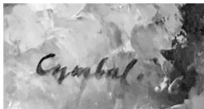
Авторський підпис на картині «Рік 1933»

«Symbal. 36» (літери написані чорною фарбою, цифри – білою, останні розташовані трохи нижче напису). Таким чином, авторська позначка дає можливість віднести момент нанесення останнього мазка на картину «Рік 1933» до 1936 р.