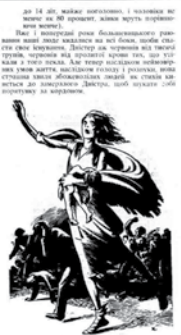
Та й то чим час був... ...