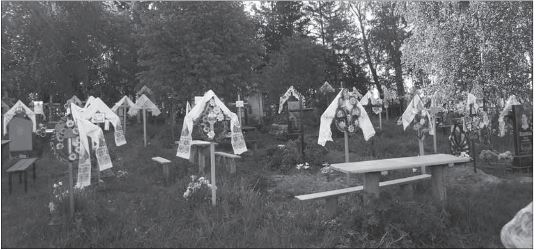
Рис. 3. Шляхетське кладовище між родовими селами околичної шляхти Левковичами та Можарами