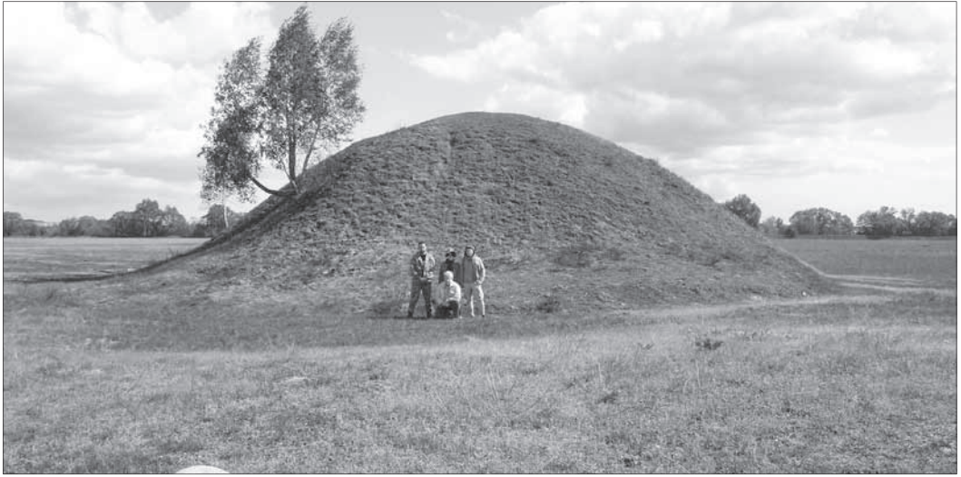
Рис. 5. Курган X ст. поблизу городища селища Норинськ, яке, за археологічними даними, функціонувало з X по XVIII ст.

Володимира Великого. Інакше кажучи, корінні мешканці Овруччини продовжують дотримуватися киеворуської традиції, що пережила тисячоліття.