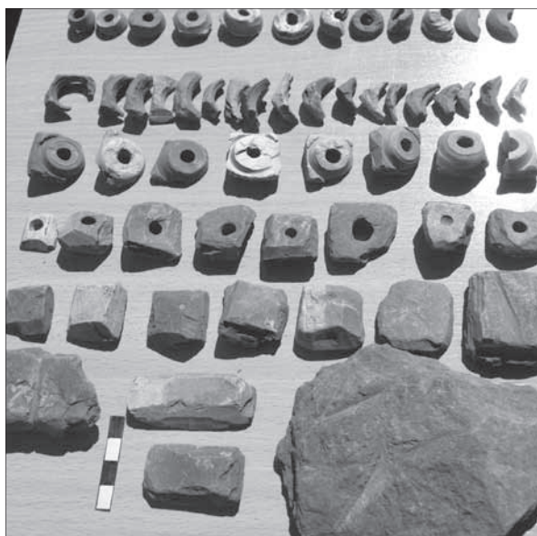
Рис. 2. Рештки виробництва пірофілітових пряслиць з селища-майстерні XI–XIII ст. поблизу с. Нагоряни

відрізняються від селян ні ментальністю, ні способом життя, не платять податків, не підлягають державній службі, користуючись дворянськими привілеями», – писав губернатор. Ці люди говорять по-малоросійськи, однак вони, не зважаючи на бідність, живуть гідно і чисто. В одному з сіл нарахували понад тисячу душ з однаковим прізвиськом, і всі вони вважають себе дворянами. На рапорт губернатора Микола I наклав резолюцію – «Строго изучить!» [3, с. 171, 172].