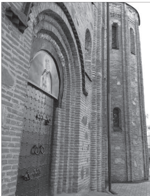
Рис. 1. Стіни храму Святого Василя XII ст. в м. Овруч

В XI–XIII ст. на Овруччині налагодили масове виробництво прясел з пірофіліту – цінного мінералу рожевого кольору (Рис. 2). Пірофілітові прясла були надзвичайно популярні у Східній та Центральній Європі. З Овруча вони поширювалися на північ до Скандинавії, на схід до Уралу, на південь до Криму та Болгарії, на захід в басейни Вісли та Одери. Існує гіпотеза, що овруцькі