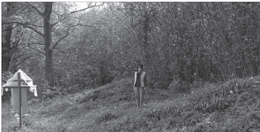
Рис. 4. Сучасні могили поряд із курганами X–XIII ст. на кладовищі с. Желонь, що функціонує з домонгольських часів

На Овруцькому кражі відомо близько 80 киеворуських курганных могильників. Багато з них до сьогодні використовуються місцевими жителями як традиційні місця поховань. Фактично принаймні частина кладовищ Овруччини функціонує як цвинтарі з часів