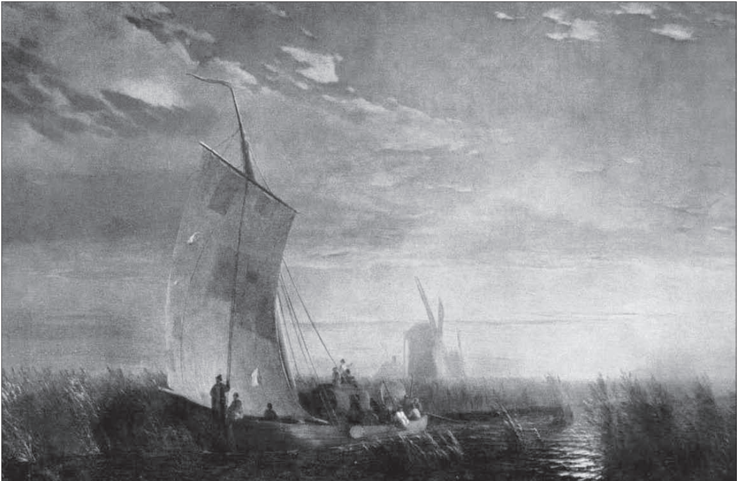
Іван Айвазовський. Очерет на Дніпрі поблизу Олешок, 1858 р.

баталії та види з суші на море, а й живописні краєвиди українського причорноморського степу, при цьому з глибоким розумінням змальовував життя чумаків та рибалок у картинах «Пейзаж з вітряками» (1860), «Валка чумаків» (1862), «Український пейзаж з чумаками при місяці» (1869), «Чумаки на відпочинку» (1885), «Валка в степу» та побут українського народу у картинах «Очерет на Дніпрі» (1857), «Український пейзаж» (1868), «Млин на березі річки. Україна» (1880). На полотнах художника збереглися численні пейзажі Криму та материкової України, зокрема, його картини дають уявлення про те, як виглядали міста Ялта, Гурзуф, Одеса, Феодосія на початку ХІХ ст.: «Ялта» (1838), «Місячна ніч у Криму. Гурзуф» (1839), «Одеса» (1840), «Вид в Криму після заходу сонця» (1862), «Феодосія. Захід сонця» (1865),