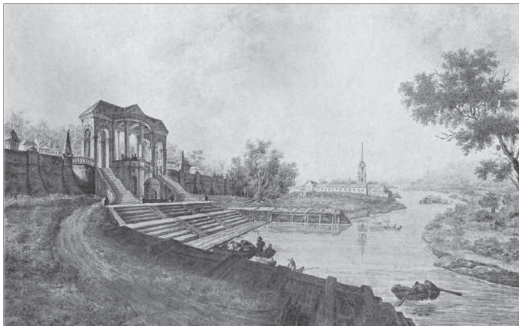
Олександр Кунавін. Вид альтанки зі спуском на Десну пана Судієнка, початок 1800-х рр.

архітектури окремих провінційних міст і сіл України, зокрема Київщини, Сумщини, Полтавщини та Чернігівщини, був російський художник Олександр Кунавін (1780 – 1814 рр.). Даних про його життя збереглося мало. Навчався у Петербурзькій Академії мистецтв у пейзажистів С. Щедрина та Ф. Алексеєва. Гостюючи у Качанівці у Рум'янцевих, він написав декілька акварелей палацово-паркового ансамблю «Садиба в Качанівці» (1803 – 1809). На одній із картин «Вид альтанки зі спуском на Десну пана Судієнка» зберігся вид на річку, садибу та парк у с. Очкине (Сумської області), що проглядають через гармонійну у своїй простоті білосніжну напівкруглу колонадну альтанку-пристань початку XIX ст. Штучна пишність барокової пристані та кам'яної палацової стіни у лівій частині картини ще більш мистецьки підкреслюється розкішною природною