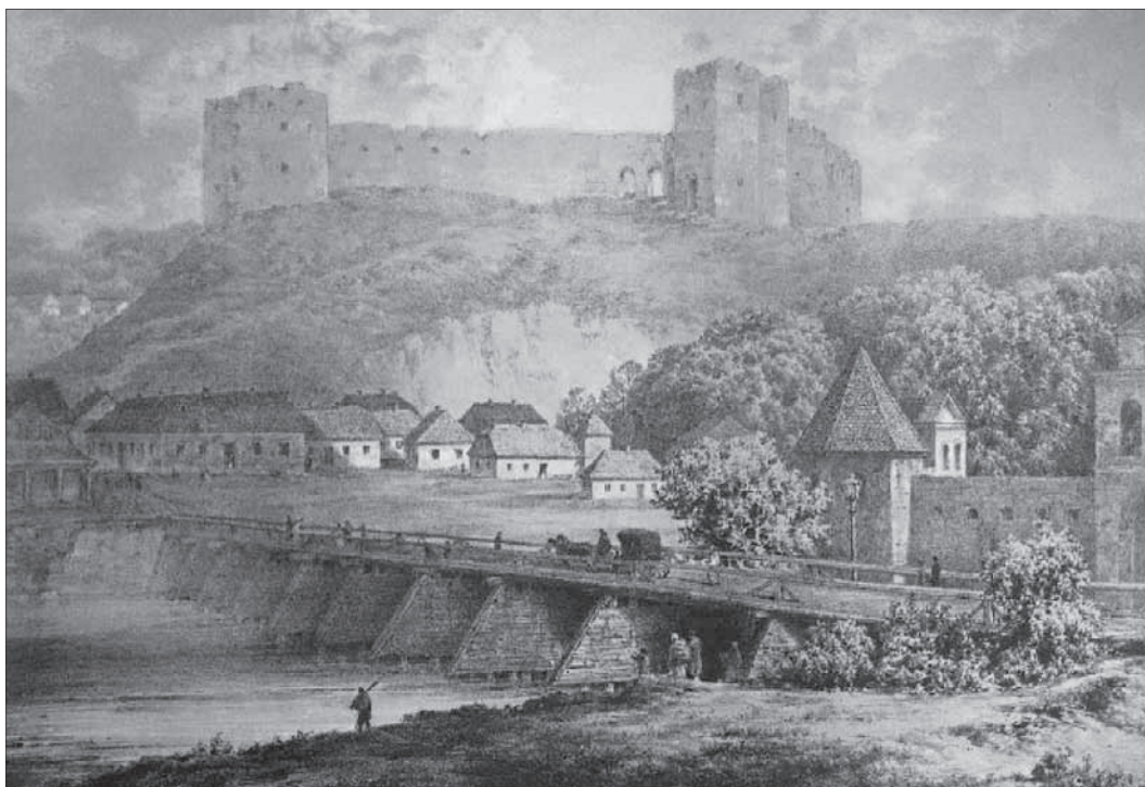
Наполеон Орда. Місто Тербовля над річкою Гнізна. Замок. 1631 р. Літографія

фортеці в Кам'янці-Подільському, замків у Дубно та Острозі. Природні умови та архітектурні споруди України частково або зовсім змінилися за понад два століття, а на полотнах Н. Орди вони реалістично змальовані і є достеменним першоджерелом уточнених даних, а отже – цінними для історико-мистецької спадщини. Видання 8 збірок оригінальних літографій було здійснене протягом 1875–1883 рр. Зокрема, природа у творах художника – не антураж для зображення архітектурних споруд, а гармонійно вплетений до сюжету засадничий мотив. Найяскравіше це передають літографії, на яких доволі чітко можна визначити не лише форми рельєфу, а й навіть окремі види рослин: «Руїни оборонного замку князів Острозьких в Острозі» (XIV – XIX ст.), «Село Верхівня. Маєток