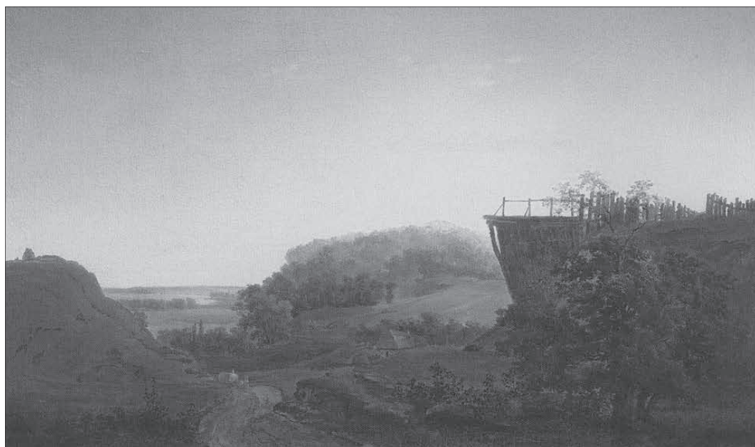
Олексій Саврасов. Український пейзаж, 1849 р.

характерні особливості довкілля, зокрема рельєфу, та різних природних змін. Нині ці картини являють собою як мистецьку, так і історичну цінність. Як талановитий викладач О. Саврасов навчав своїх учнів відображати краєвиди, пропускаючи їх через свої найбільш сокровенні переживання, що відповідало духу пересувництва [14].