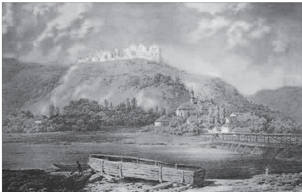
Наполеон Орда. Місто Галич при впадінні річки Лукви до Дністра. Руїни замку. 1367 – 1658 рр. Літографія

До створення краєвидів України також доклав зусиль художник Наполеон Орда (11.02.1807 – 20.04.1883). Народився у заможній родині творчої інтелігенції у Мінській губернії, професійну