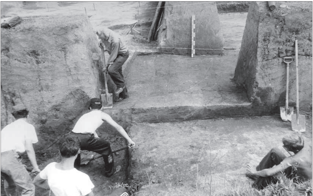
Галичина могила. 1992 р. Поховання. Видгляд з Пд.

Також у 1992 р. археологи розпочали вивчення фортифікаційних споруд давнього Галича. Спочатку вони провели комплексну розвідку Крилоського городища та його околиць. Це дало змогу дослідникам скласти детальний план