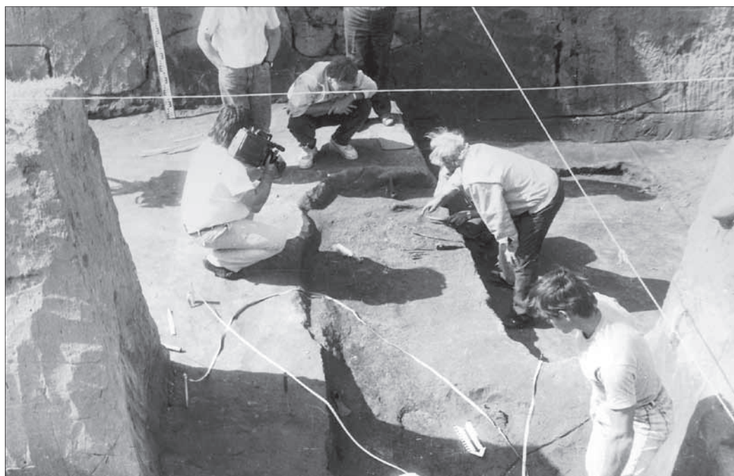
Галичина могила. 1992 р. Поховання. Вигляд з Пн. Сх.

будинок, датований XII – XIII ст. [5, арк. 4–10].