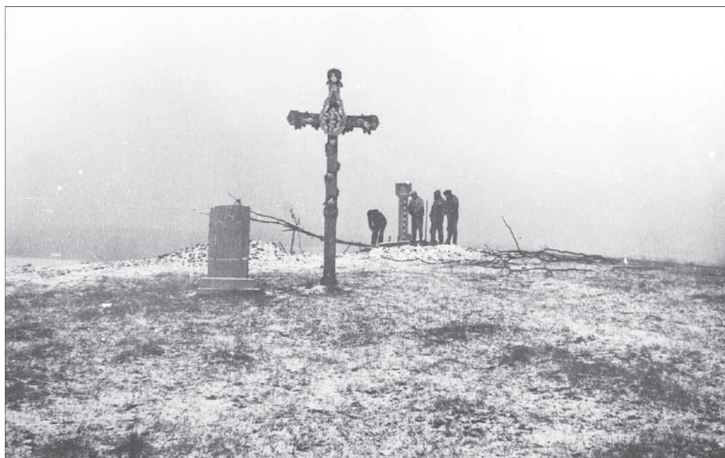
Крилос. 1991 р. Галичина могила