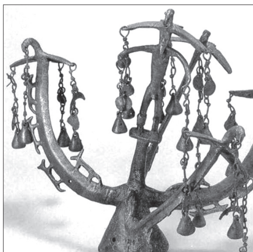
Ілюстрація 1. Фрагмент бронзової верхівки скіфського бунчука-штанدارта із зображенням божества (ймовірно, Папая), яструбів та вовків. Скіфія, IV ст. до н. е. Виявлено на кургані Лиса Гора (Дніпропетровська область, Україна). Взято: http://www.pslava.info/DniproM_LysaGora_NavershJalZobrazhennjamPapaja_055-1,83902.html . Джерело: Scythian gold: Museum of historic treasures of Ukraine. S. 1: 1992, p. 55.

з іклів вовків та ведмедів, що мали слугувати як амулети [19, с. 85, 149].