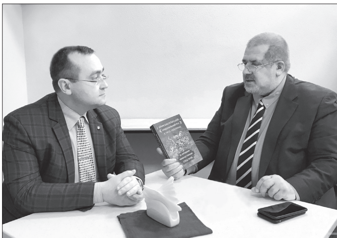
А. Іванець і голова Меджлису кримськотатарського народу, народний депутат України кількох скликань Рефат Чубаров.

Подальші події продовжують виявляти ці паралелі – але вже в їхньому трагічному наслідку. Большевицький переворот однаково був неприйнятним ні для українців, ні для кримських татар, тому і війна ленінського Совнаркому проти них мала всі