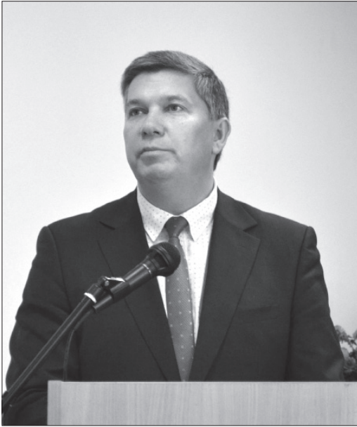
Перший заступник міністра Міністерства культури та інформаційної політики України Р. В. Карандеєв

використовуючи модерні практики, воно не лише вивчає минуле, сучасне, а й моделює майбутнє України. Наразі українознавство цікавить не лише нас, нам треба виходити за межі України й розповсюджувати знання про нашу Батьківщину по всьому світу. У багатьох світових університетах є кафедри слов'яністики, а нам треба створювати кафедри українознавства, треба використовувати англійську мову як потужний інструмент поширення знань про Україну й український народ. Ми маємо запропонувати Українській державі й українському суспільству нові напрямки розвитку. Українська держава – це модерна держава з великими перспективами».