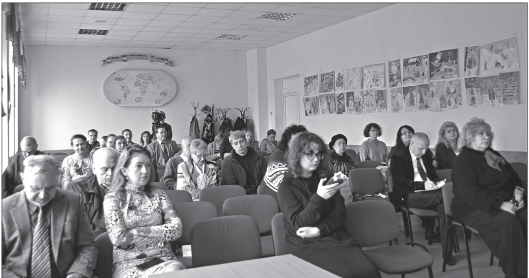
Учасники наукового форуму

Задля успішного проведення наукового форуму був сформований організаційний комітет. Його очолили: доктор економічних наук, державний секретар Міністерства освіти і науки України С. В. Захарін та доктор філософії, професор, в. о. директора НДІУ МОН України, лауреат Державної премії України в галузі науки і техніки В. Г. Чернець. Заступниками співголів оргкомітету стали: