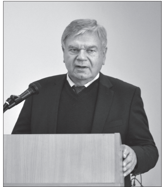
Президент Національної академії педагогічних наук України В. Г. Кремень

Доктор філософських наук, професор, академік НАН України та АПН України, президент Національної академії педагогічних наук України В. Г. Кремень у привітальному слові підкреслив, що українознавство допомагає формувати український гуманітарний простір. На його думку, в сучасному українському суспільстві має бути сформована пошана до вояків Української Повстанської Армії. «Я з Сумщини, – відзначив Василь Григорович, – де був потужний партизанський рух, який всіляко підтримувала радянська влада, тоді як бійці Української Повстанської Армії воювали винятково за ідею Самостійної Соборної Держави. Сучасна українська молодь прямо зараз на полі бою успішно