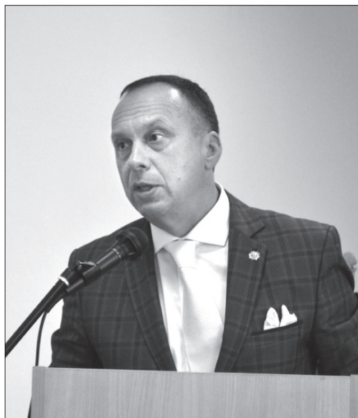
Ректор Національної музичної академії України ім. П. І. Чайковського М. О. Тимошенко

український гуманітарний простір, який має остаточно покінути із залишками радянщини. Я виріс і сформувався як особистість на ваших працях, тому вчені-українознавці надалі мають працювати в ім'я України».