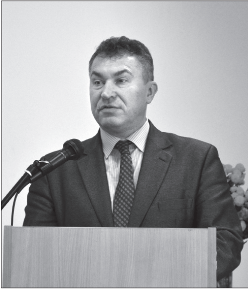
Генеральний директор директорату дошкільної, шкільної, позашкільної та інклюзивної освіти МОН України О. В. Єресько

про свою роботу на ниві впровадження українознавства, головні завдання, які поставлені В. Г. Чернецем перед філіями, й практичні способи їх виконання.