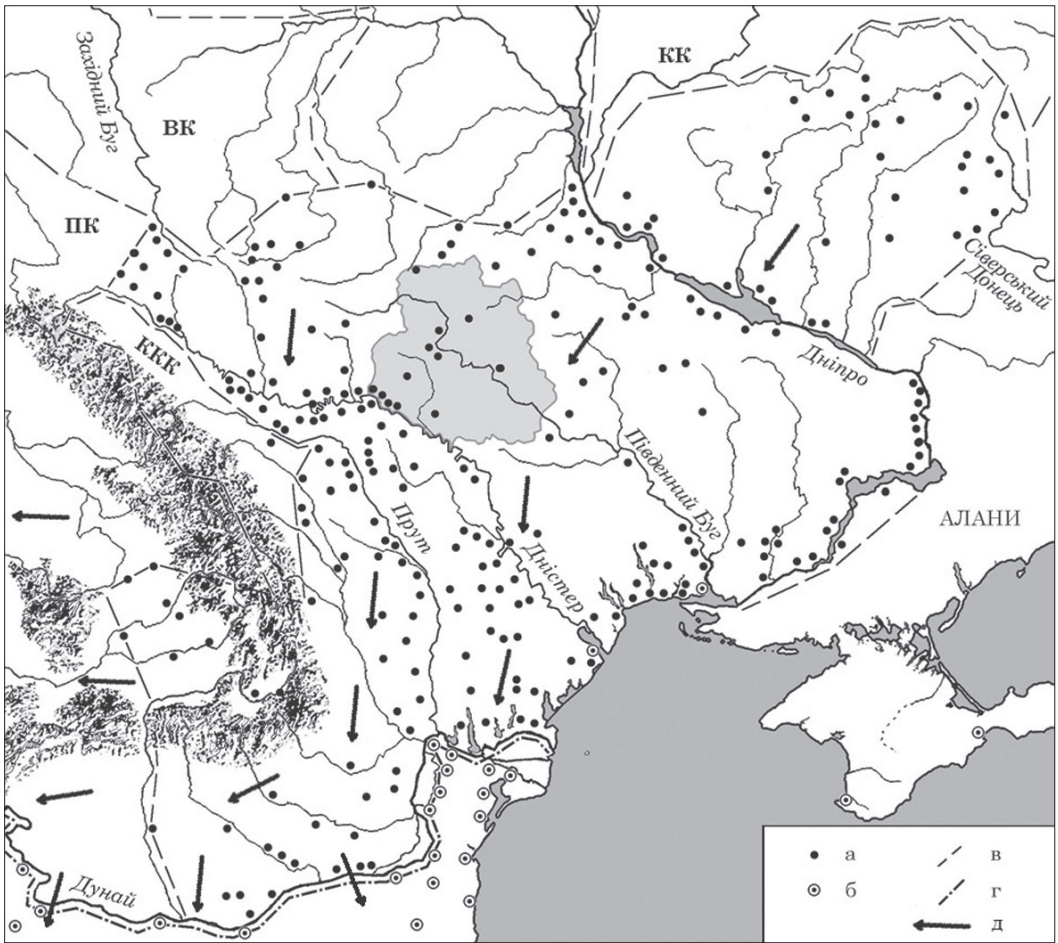
Рис. 1. Карта пам'яток племен антів і склавинів черняхівської культури Б. Магомедова з нашими доповненнями напрямків їх руху під час великого переселення в Подунав'я і на Балкани.

ПК - пшеворська культура; VK - вельбарська культура;