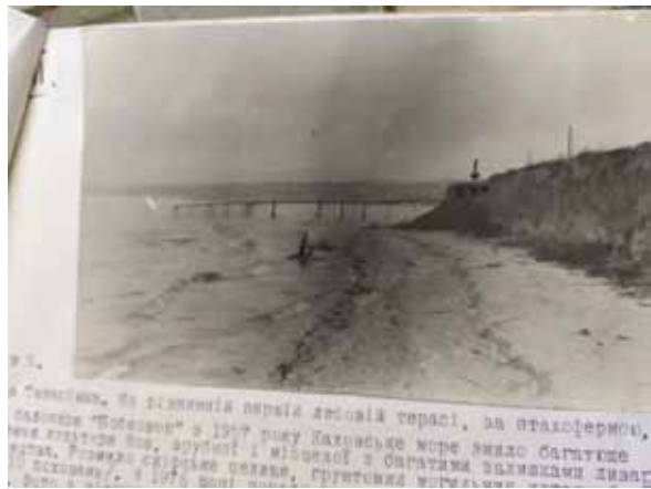
Рис. 10. Вищетарасівське селище IV ст. до н. е.: 1 - план-схема; 2 - вигляд пам'ятки після 1957 року (за О. Бодянським)

Розвідки на берегах створеного Каховського водосховища у перші роки його існування свідчать про невинну руйнацію археологічних пам'яток, що потрапили у зону дії новобудови. Від берегової ерозії потерпали і раніше зафіксовані поселення та городища, і знову відкриті локалізовані на берегах заплави Дніпра, до яких дійшла вода. Як приклад можна навести руйнування берега