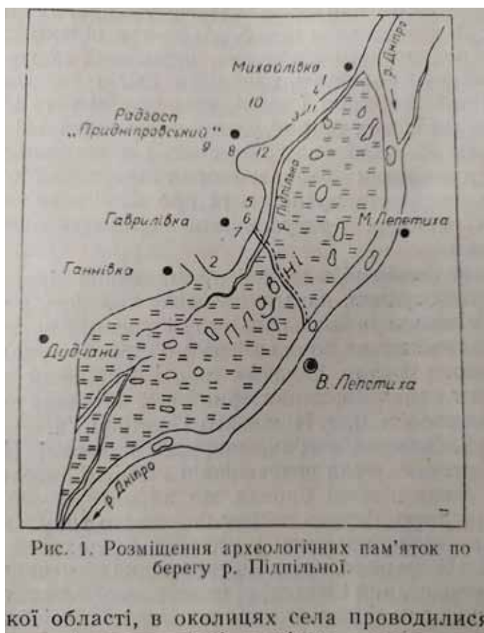
Рис. 1. Розміщення археологічних пам'яток по берегу р. Підпільної.