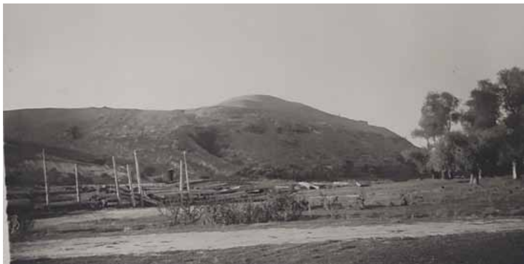
Рис. 3. Старошведське (Зміївське) постскіфське городище за станом на 1952 рік (за А. Бураковим)