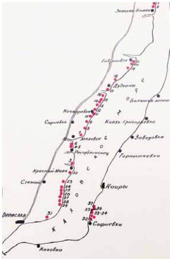
Рис. 8. Карта-схема маршруту розвідки А. Щепинського у 1957 р. (за А. Щепинським): 1 - Червоний Маяк - знахідки; 2 - Рагулі - знахідки; 3 - Червоний Маяк - городище; 3а - Червоний Маяк - неолітичний могильник; 4 - Республіканець-Кам'янська Січ; 5 - Республіканець - неолітичний могильник; 6 - Республіканець-Консулівське городище; 7 - Мелове - виходи каменю; 8 - Качкаровка - селище; 9 - Комарівка - поселення доби бронзи; 10 - Качкаровка - поселення доби бронзи; 11 - знахідки кераміки і кісток; 12 - знахідки кераміки і кісток; 13 - Саблуківка - могильник і поселення; 14 - скелет людини; 15 - Дудчани - скелет людини; 16 - Дудчани - поселення доби бронзи; 18 - Ганнівське (Аннівське) городище; 19 - поселення; 20 - знахідки кераміки; 21 - Гаврилівське городище; 22 - Червоний Маяк - кераміка доби бронзи; 23 - кістки людини; 24 - Вербовка - скіфське городище; 25 - кістки людини; 26 - Вербовка - поселення; 27 - кераміка; 28 - Зміївка, неолітичний могильник; 29 - Михайлівка; 30 - могильник; 31 - Дрімайловка - поселення доби бронзи; 32 - Васильовка - могильник; 33 - Васильовка - стоянка; 34 - кераміка, неолітичний молот; 35 - скелет людини; 36 - кістки тварин; 37 - могильник

у воді, що швидко прибувала. Їх з трудом вихвачено з розбурханої стихії» [4, 1957/10-6].