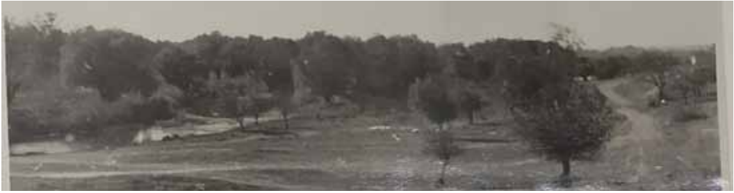
Рис. 5. Заплава Дніпра - вигляд зі Старошведського городища (за А. Бураковим)

Основні роботи у зоні руйнації почалися з розвідок. Найбільш значущим був внесок співробітників Нікопольсько-Гаврилівської експедиції, дослідження якої «мали охопити обидва береги Дніпра від Розумовки до Каховки» [14, с. 3], тобто фактично всю зону майбутнього водосховища.