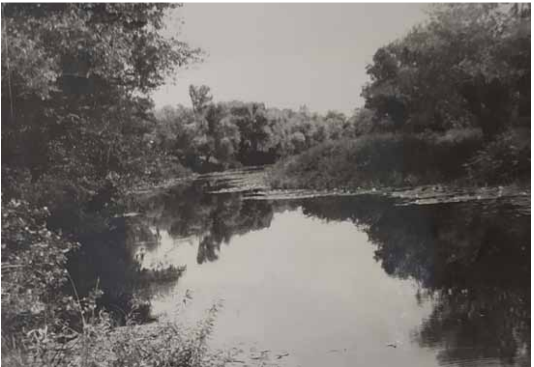
Рис. 4. Заплава Дніпра - протока Космах біля Старошведського городища (за А. Бураковим)