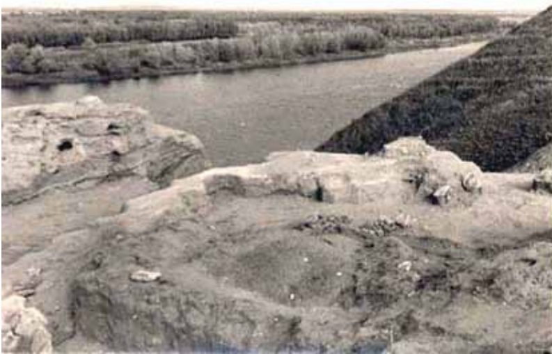
Рис. 2. Любимівське постскіфське городище за станом на 1952 рік (за Л. Дмитровим)

населені пункти. На вигині Дніпра, де він повертає на північ, на високому березі, на самому краю степ зливається зі згаданим городищем Старошведським, що, безсумнівно, в давнину являло собою дуже великий і добре укріплений населений пункт, до теперішнього часу абсолютно недосліджений і в даний час дуже енергійно і активно руйнується як силами природи, так і оточуючих людей. Між берегами розкішно та ошатно розкинулася зелена смуга плавнів, усіяних деревами, чагарниками, осокою, травою. В плавнях розташовані чудові пасовища для худоби, сенокоси, бахчі, городи. У плавнях люди дістають паливо і часто-густо стройовий ліс і матеріал, у плавнях вони полюють і ловлять рибу. Мимоволі побачивши ці місцевості, виникає думка, що відома Геродоту і згадувана ним у його історії Гілея доходила до Любимівських плавнів» [12, с. 15] (переклад. – Н. Г.). Ілюстраціями до цього опису можуть бути фотографії зі звітів Л. Дмитрова, А. Буракова (Рис. 4–5).