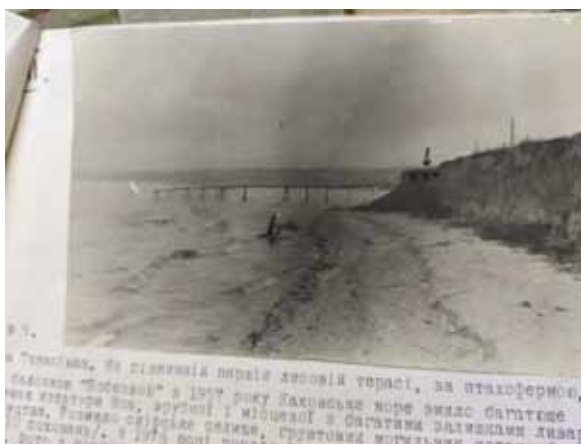
Рис. 10. Вищетарасівське селище IV ст. до н. е.: 1 - план-схема; 2 - вигляд пам'ятки після 1957 року (за О. Бодянським)

Розвідки на берегах створеного Каховського водосховища у перші роки його існування свідчать про невинну руйнацію археологічних пам'яток, що потрапили у зону дії новобудови. Від берегової ерозії потерпали і раніше зафіксовані поселення та городища, і знову відкриті локалізовані на берегах заплави Дніпра, до яких дійшла вода. Як приклад можна навести руйнування