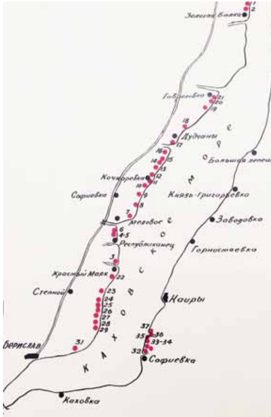
Рис. 8. Карта-схема маршруту розвідки А. Щепинського у 1957 р. (за А. Щепинським): 1 - Червоний Маяк - знахідки; 2 - Рагулі - знахідки; 3 - Червоний Маяк - городище; 3а - Червоний Маяк - неолітичний могильник; 4 - Республіканець - Кам'янська Січ; 5 - Республіканець - неолітичний могильник; 6 - Республіканець-Консулівське городище; 7 - Мелове - виходи каменю; 8 - Качкарівка - селище; 9 - Комарівка - поселення доби бронзи; 10 - Качкарівка - поселення доби бронзи; 11 - знахідки кераміки; 12 - знахідки кераміки і кісток; 13 - Саблуківка - могильник і поселення; 14 - скелет людини; 15 - Дудчани - скелет людини; 16 - Дудчани - поселення доби бронзи; 18 - Ганнівське (Аннівське) городище; 19 - поселення; 20 - знахідки кераміки; 21 - Гаврилівське городище; 22 - Червоний Маяк - кераміка доби бронзи; 23 - кістки людини; 24 - Вербівка - скіфське городище; 25 - кістки людини; 26 - Вербівка - поселення; 27 - кераміка; 28 - Зміївка, енеолітичний могильник; 29 - Михайлівка; 30 - могильник; 31 - Дрімайлівка - поселення доби бронзи; 32 - Васильівка - могильник; 33 - Васильівка - стоянка; 34 - кераміка, неолітичний молот; 35 - скелет людини; 36 - кістки тварин; 37 - могильник

у воді, що швидко прибувала. Їх з трудом вихвачено з розбурханої стихії» [4, 1957/10-6].