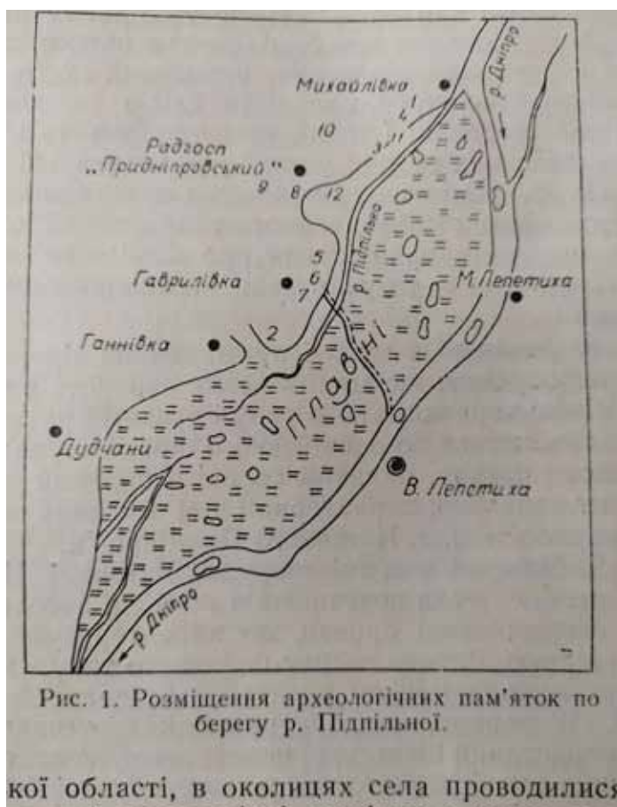
Рис. 1. Розміщення археологічних пам'яток по берегу р. Підпільної.