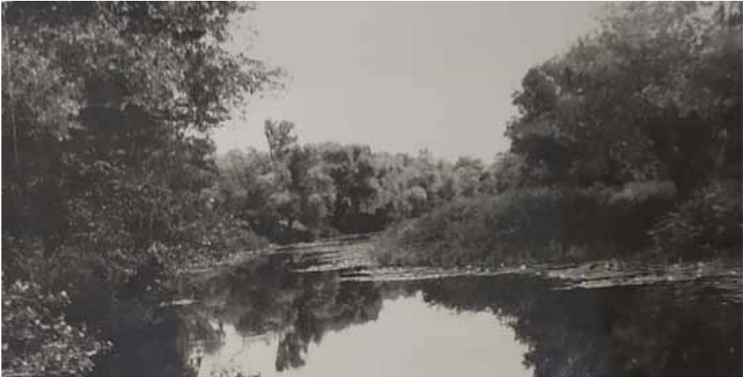
Рис. 3. Старошведське (Зміївське) постскіфське городище за станом на 1952 рік (за А. Бураковим)