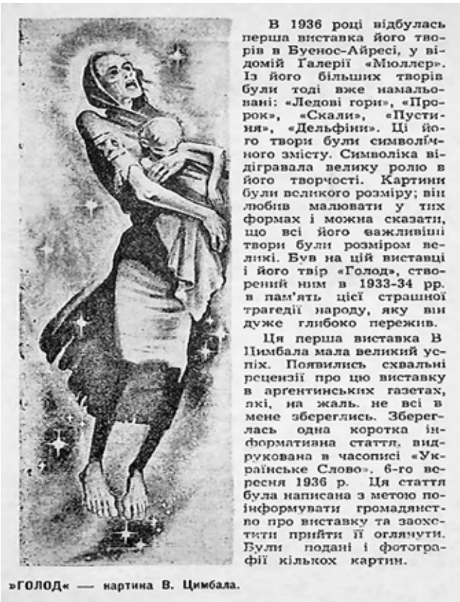
»ГОЛОД« — картина В. Цимбала.

опорою на різноманітні джерела уточнити інформацію про дату створення та першого експонування першотвору про Голодомор – картини В. Цимбала «Рік 1933».