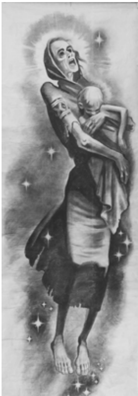
Варіант картини В. Цимбала «Рік 1933» (вугілля, папір)

Більш детально про цю виставку можна дізнатися з іспаномовного каталогу, який зберігається у родинному архіві Цимбалів. Відбувалася вона 9–22 листопада 1956 р. у столиці провінції Буенос-Айрес Ла Платі, ймовірно, у приміщенні Об'єднання журналістів провінції (ця організація зазначена на першій сторінці каталогу). Всього було виставлено 27 картин, серед яких у каталозі під номером 12 значиться «Рік 1933», причому з поясненням у дужках: