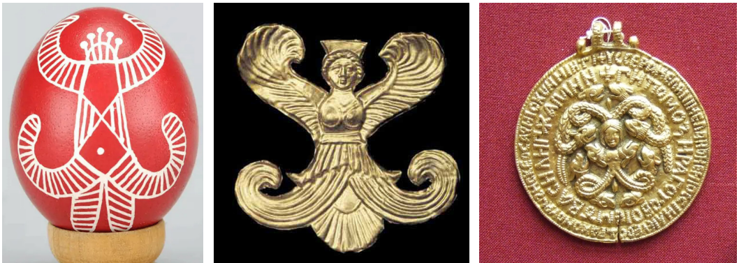
Рис. 2. Писанка Берегиня. Скіфська Богиня Апі. Амулет-змійовик, Русь.

Дослідники переважно вбачають у них зображення Великої Богині або Берегині-Покрови (А. Голан, Б. Рибаків, В. Скуратівський, В. Давидюк). У 1981 р. В. Давидюк записав на Поліссі легенду про віщу птицю: «Начебто саме птах із великими крильми попереджував гребців, що на місці сіножаті от-от має з'явитися озеро: «Забирайте, люди, сіно, бо тут буде озеро Віно» (м. Троянівка) [5, с. 186]. Науковець звертає увагу на артефакти Русі, зокрема зображення кольорової птиці на колтах: «Чи не та це птиця-слава з різнобарвним пір'ям, викладена перетинчастою емаллю на золотому колті з Княжої гори на Канівщині (вважається залишками літописного міста Роденя). Помилково її визнали павичем, бо в природі подібного птаха не існує» [5, с. 187]. Тут доречно згадати одну з її функцій, пов'язаних зі «словом», тобто в буквальному сенсі передачі інформації , а також наявність Богинь мовлення в індоєвропейській міфології (ведична Вач, давньогрецька Осса, римська Фама). Усі ці Богині є вісницями верховного Бога [17].