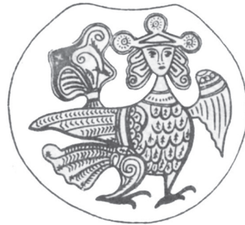
Рис. 3. Колт з кольоровим птахом з Княжої гори. Прорис кийвського колта з жінкою-птахом.