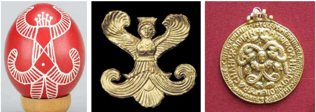
Рис. 2. Писанка Берегиня. Скіфська Богиня Апі. Амулет-змійовик, Русь.

Дослідники переважно вбачають у них зображення Великої Богині або Берегині-Покрови (А. Голан, Б. Рибаків, В. Скуратівський, В. Давидюк). У 1981 р. В. Давидюк записав на Поліссі легенду про віщу птицю: «Начебто саме птах із великими крильми попереджував гребців, що на місці сіножаті от-от має з'явитися озеро: «Забирайте, люди, сіно, бо тут буде озеро Віно» (м. Троянівка) [5, с. 186]. Науковець звертає увагу на артефакти Русі, зокрема зображення кольорової птиці на колтах: «Чи не та це птиця-слава з різнобарвним пір'ям, викладена перетинчастою емаллю на золотому колті з Княжої гори на Канівщині (вважається залишками літописного міста Роденя). Помилково її визнали павичем, бо в природі подібного птаха не існує» [5, с. 187]. Тут доречно згадати одну з її функцій, пов'язаних зі «словом», тобто в буквальному сенсі передачі інформації , а також наявність Богинь мовлення в індоєвропейській міфології (ведична Вач, давньогрецька Осса, римська Фама). Усі ці Богині є вісницями верховного Бога [17].