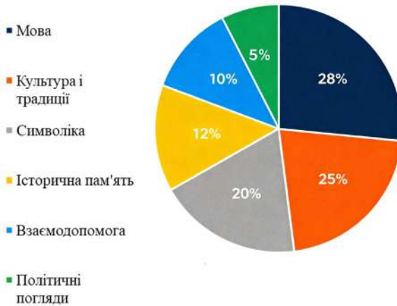
Діаграма 1 Компоненти, що формують українську ідентичність

просування української культури, адже рекламування творів українських письменників та здобутків української історії не дає очікуваних результатів, а популяризація культурних надбань потребує сучасних підходів.