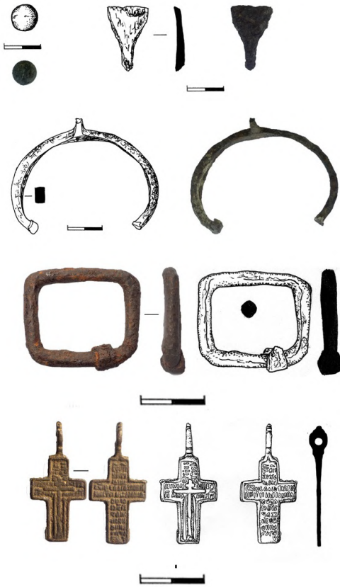
Рис. 3. Металеві вироби з матеріалів Кам'янської Січі.

(21 фрг.), горнятка (1 цілий екземпляр та 3 фрг.), кухлі (3 фрг.), тарілки (3 зразки), миски (2 фрг.), сільнички (4 одиниці з п'ятнадцяти фрагментів). Форму деяких виробів, представлених дрібними фрагментами, ідентифікувати неможливо (2344 фрг.) [16] (Рис. 1).