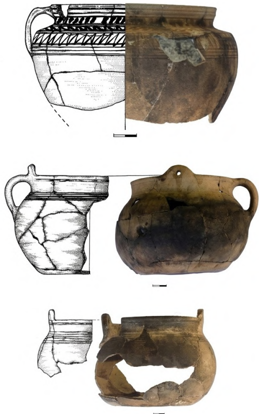
Рис. 1. Керамічний посуд матеріалів Кам'янської Січі.

Зазначені руйнування становлять лише частину відомих втрат культурної спадщини на території пам'ятки. Реальний масштаб пошкоджень може бути значно більшим і потребує комплексного археологічного та пам'яткоохоронного