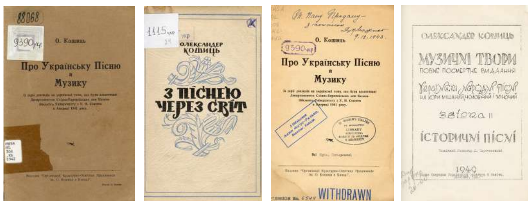
Фото рідкісних книг, які висвітлюють творчу спадщину О. Кошиця, що зберігаються у фонді відділу зарубіжної україніки Інституту книгознавства НБУВ.

У 1908 р. О. Кошицю пропонують очолити студентський хор Київського університету, в репертуарі